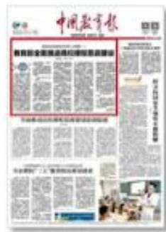
《中国教育报》 头版头条报道 课程思政工作