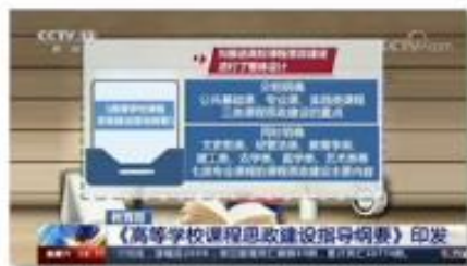
中央电视台 《朝闻天下》