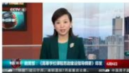
中央电视台 《今日环球》