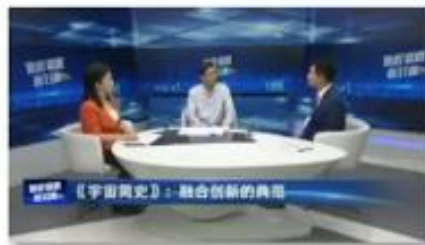
中国教育电视台 《课程思政面对面》