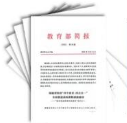
编发六期 《教育部简报》