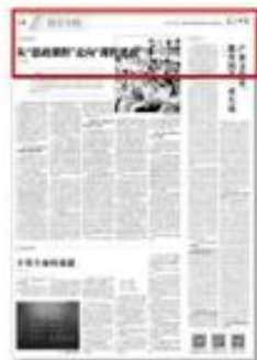
《光明日报》 发表十余篇 专家解读文章