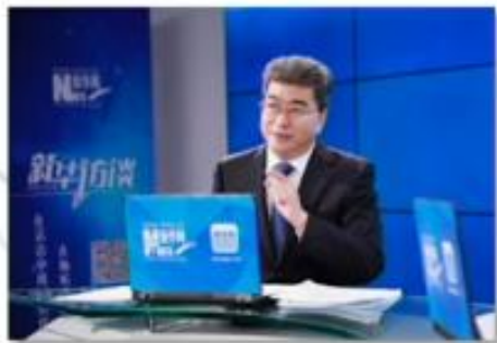
新华网专访 介绍课程思政